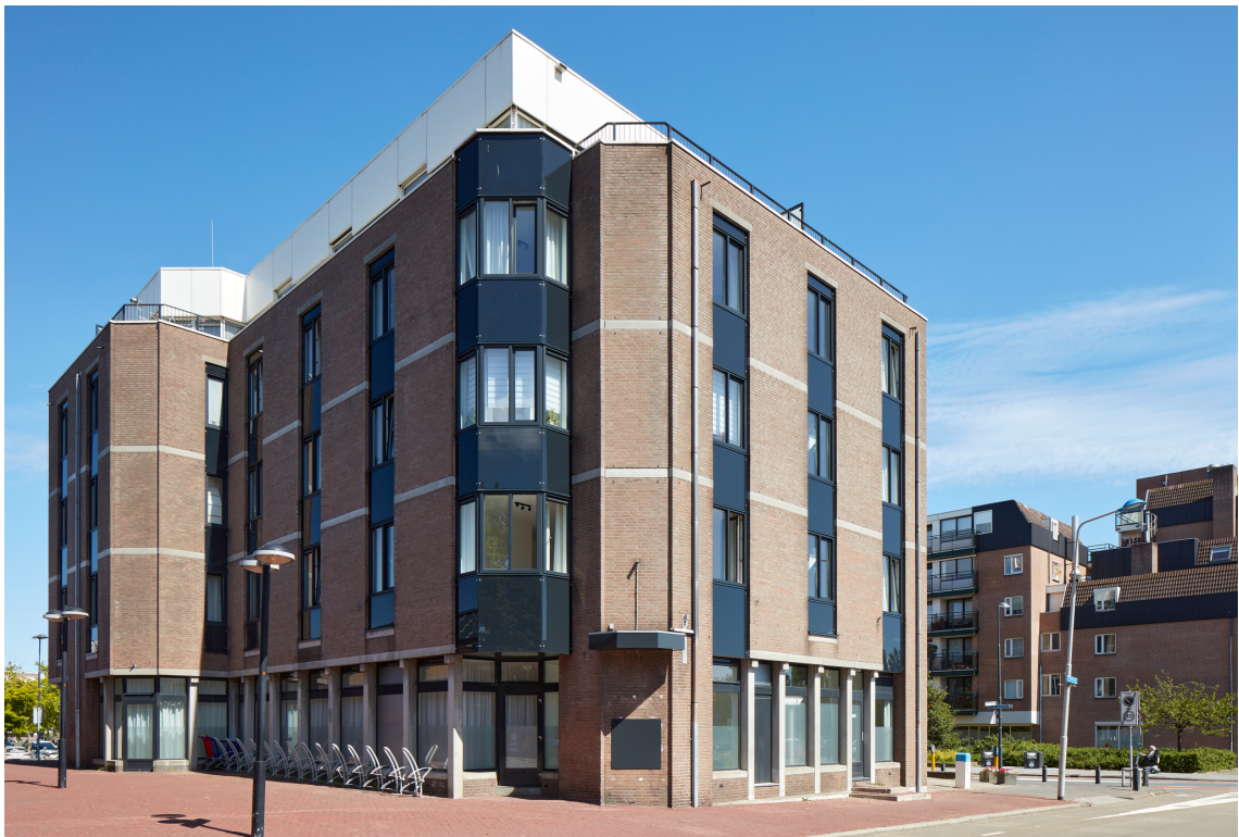
Graaf Janstraat 22A, Beverwijk