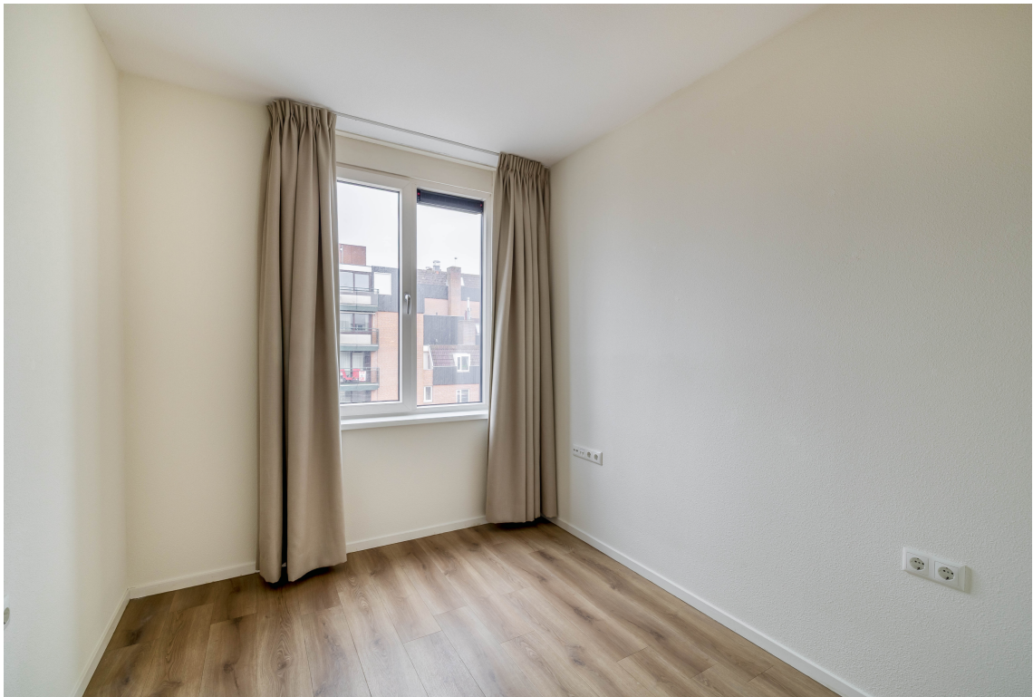
Graaf Janstraat 22A, Beverwijk